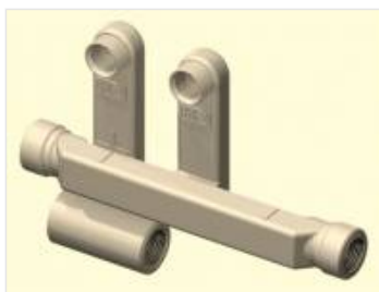
Przyłącza grzejnikowe (12)