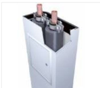
Listwy maskujące (10)