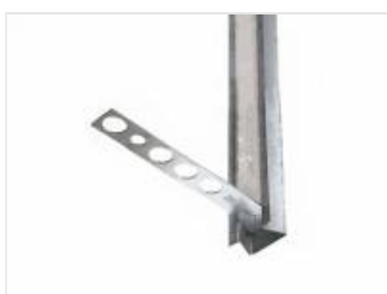
Wzmacnianie konstrukcji (1)