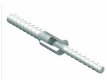
Łączniki do zbrojenia (2)