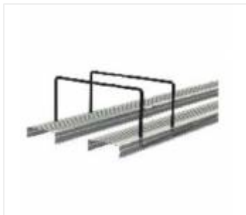
Zbrojenie odginane (12)