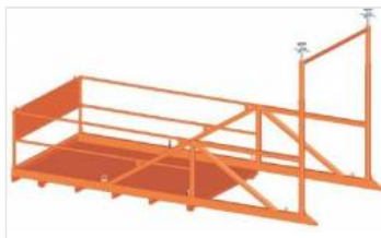
Podesty rozładunkowe (1)