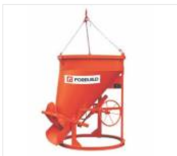
Pojemniki na beton (4)