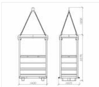
Kosze do transportu osobowego (1)