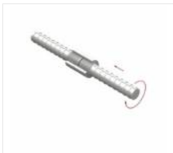
Łączniki do zbrojenia (7)