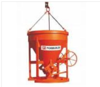
Pojemniki na beton (1)