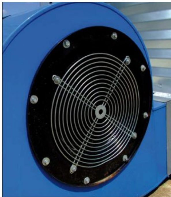
Fot. 3.