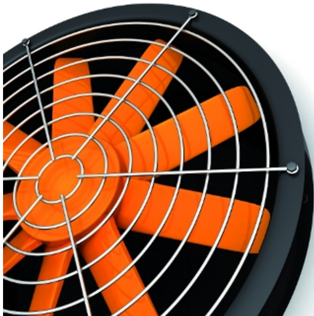
Fot. 2. Tim - fotolia.com

Wentylatory wyposażone w silniki elektronicznie komutowane (silniki EC) charakteryzuje niski pobór energii elektrycznej. Układ komutacji utrzymuje obroty wirnika wentylatora w optymalnym obszarze pracy. Mogą pracować przy różnych prędkościach, dopasowując się do wymaganej ilości powietrza przy zachowaniu najwyższej sprawności. Przetłaczając taką samą ilość powietrza jak wentylatory konwencjonalne pobierają wyraźnie mniej energii (oszczędności kosztów eksploatacji do 40%). Jednocześnie są to wentylatory cichsze oraz o dłuższej żywotności niż wentylatory tradycyjne.